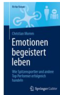
Emotionen begeistert leben Ladenpreis: 20,55EUR