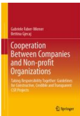
Cooperation Between Companies and Non-profit Organizations