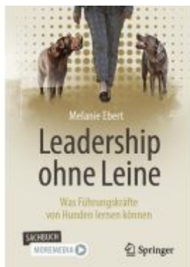
Leadership ohne Leine Ladenpreis: 25,69EUR