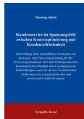
Kundenservice im Spannungsfeld zwischen Kostenoptimierung und Kundenzufriedenheit Ladenpreis: 102,60EUR