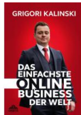
Das einfachste Online-Business der Welt