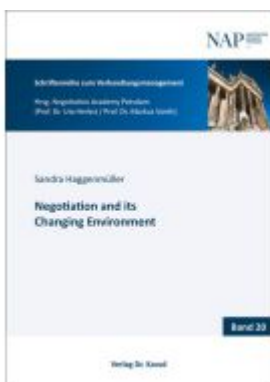
Negotiation and its Changing Environment Ladenpreis: 91,40EUR