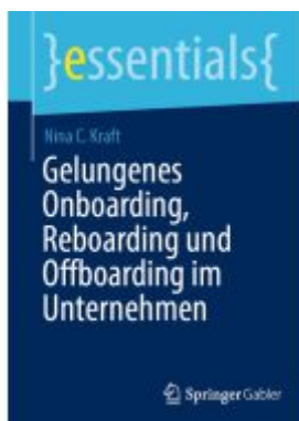
Gelungenes Onboarding, Reboarding und Offboarding im Unternehmen Ladenpreis: 15,41EUR