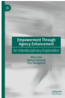
Empowerment Through Agency Enhancement Ladenpreis: 142,99EUR