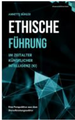
Ethische Führung im Zeitalter Künstlicher Intelligenz (KI) Ladenpreis: 22,00EUR