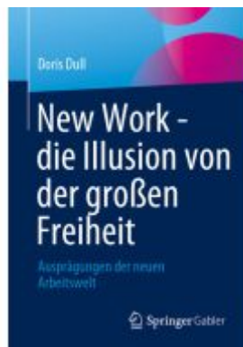
New Work - die Illusion von der großen Freiheit Ladenpreis: 39,06EUR