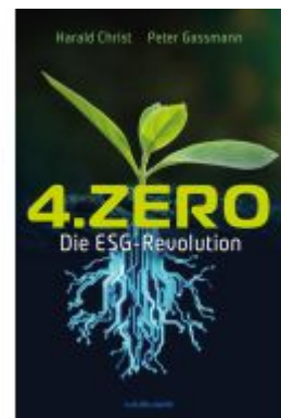
4.Zero Ladenpreis: 29,90EUR