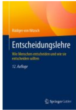
Entscheidungslehre Ladenpreis: 39,06EUR