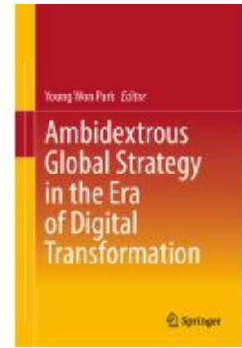
Ambidextrous Global Strategy in the Era of Digital Transformation Ladenpreis: 175,99EUR