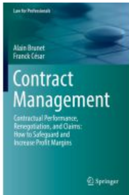
Contract Management Ladenpreis: 87,99EUR