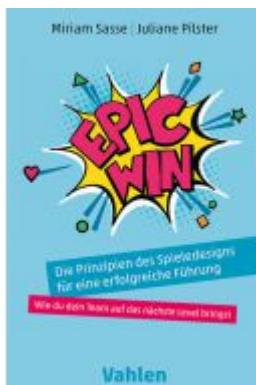
Epic Win Ladenpreis: 25,60EUR