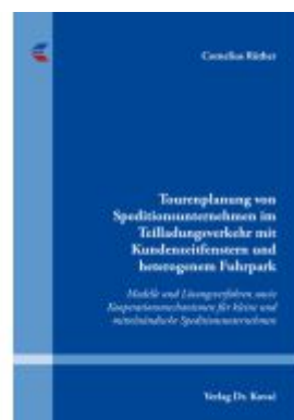
Tourenplanung von Speditionsunternehmen im Teilladungsverkehr mit Kundenzeitfenstern und heterogenem Fuhrpark Ladenpreis: 123,20EUR