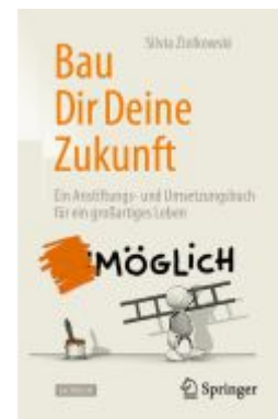
Bau Dir Deine Zukunft Ladenpreis: 20,55EUR