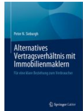
Alternatives Vertragsverhältnis mit Immobilienmaklern Ladenpreis: 66,81EUR