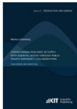
Strengthening Resilience of Supply with Essential Goods through Public-Private Emergency Collaborations: Challenges and Incentives Ladenpreis: 49,40EUR