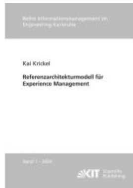
Referenzarchitekturmodell für Experience Management Ladenpreis: 50,40EUR