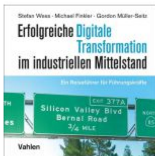
Erfolgreiche Digitale Transformation im industriellen Mittelstand Ladenpreis: 20,40EUR