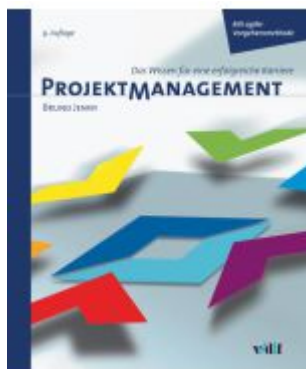
Projektmanagement Ladenpreis: 81,30EUR