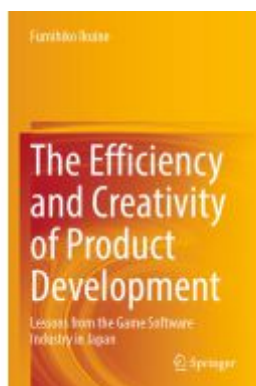
The Efficiency and Creativity of Product Development Ladenpreis: 120,99EUR