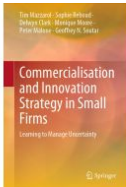
Commercialisation and Innovation Strategy in Small Firms Ladenpreis: 142,99EUR

Wir haben andere Produkte gefunden, die Ihnen gefallen könnten!