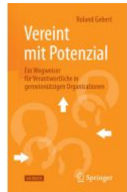
Vereint mit Potenzial Ladenpreis: 25,69EUR