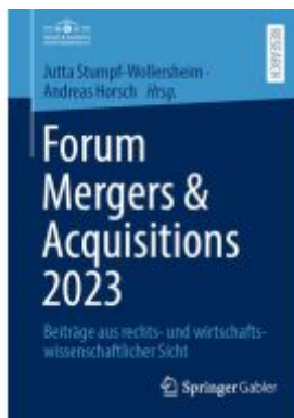
Forum Mergers & Acquisitions 2023 Ladenpreis: 92,51EUR