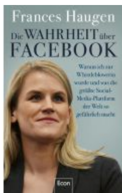
Die Wahrheit über Facebook Ladenpreis: 26,80EUR