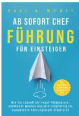
Ab sofort Chef – Führung für Einsteiger: Wie Sie schnell als neuer Vorgesetzter anerkannt werden und sich langfristig als kompetente Führungskraft etablieren | Alle wichtigen Leadership Kompetenzen Ladenpreis: 20,60EUR