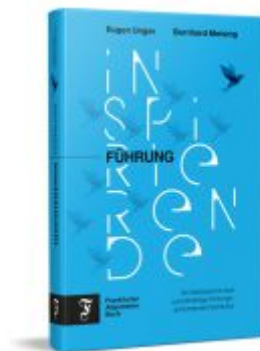
Inspirierende Führung Ladenpreis: 29,90EUR