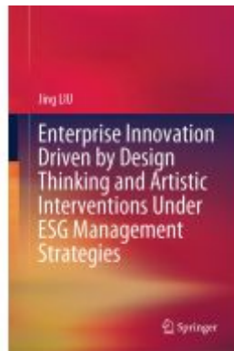
Enterprise Innovation Driven by Design Thinking and Artistic Interventions Under ESG Management Strategies