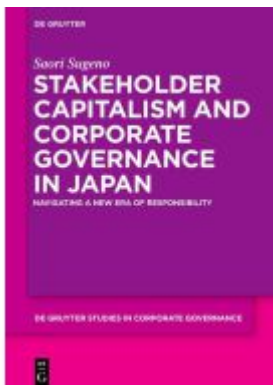
Stakeholder Capitalism and Corporate Governance in Japan