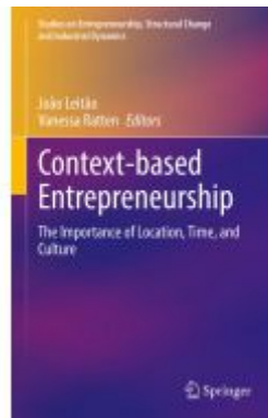
Context-based Entrepreneurship Ladenpreis: 109,99EUR