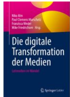
Die digitale Transformation der Medien