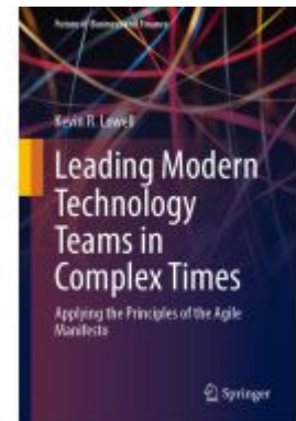
Leading Modern Technology Teams in Complex Times Ladenpreis: 93,49EUR