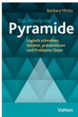
Das Prinzip der Pyramide Ladenpreis: 46,20EUR