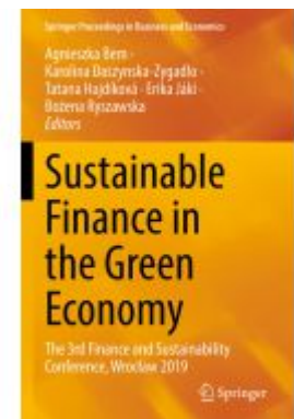
Sustainable Finance in the Green Economy Ladenpreis: 219,99EUR