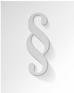
Entrepreneurship im digitalen Zeitalter