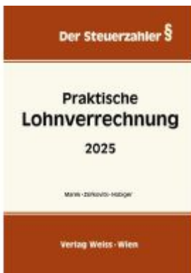
Praktische Lohnverrechnung 2025 Ladenpreis: 72,60EUR