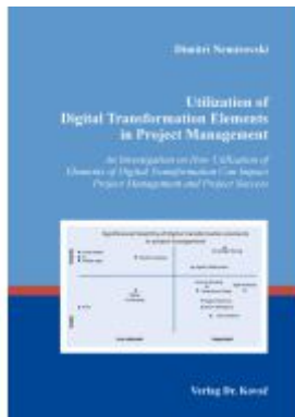
Utilization of Digital Transformation Elements in Project Management Ladenpreis: 102,60EUR