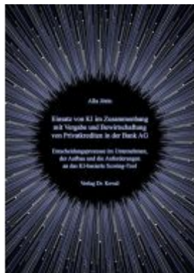
Einsatz von KI im Zusammenhang mit Vergabe und Bewirtschaftung von Privatkrediten in der Bank AG Ladenpreis: 76,90EUR