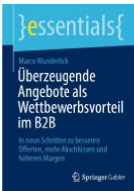
Überzeugende Angebote als Wettbewerbsvorteil im B2B Ladenpreis: 15,41EUR