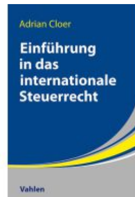
Einführung in das Internationale Steuerrecht Ladenpreis: 56,50EUR