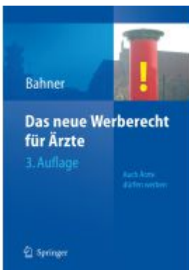
Das neue Werberecht für Ärzte Ladenpreis: 46,21EUR