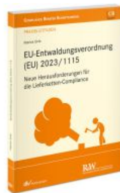
EU-Entwaldungsverordnung (EU) 2023/1115 Ladenpreis: 50,40EUR