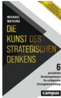
Die Kunst des strategischen Denkens Ladenpreis: 26,90EUR