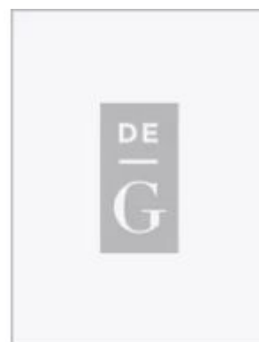
§§ 343-362 Ladenpreis: 119,95EUR