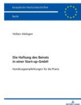
Die Haftung des Beirats in einer Start-up-GmbH Ladenpreis: 56,50EUR