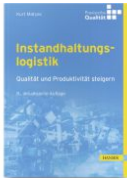
Instandhaltungslogistik Ladenpreis: 41,20EUR