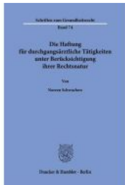
Die Haftung für durchgangszärtliche Tätigkeiten unter Berücksichtigung ihrer Rechtsnatur.