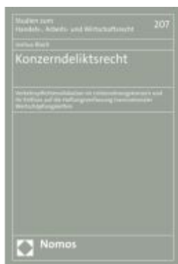
Konzerndeliktsrecht Ladenpreis: 153,20EUR