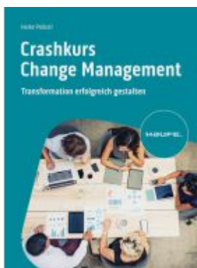
Crashkurs Change Management Ladenpreis: 30,90EUR