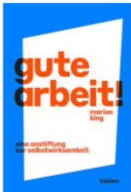
Gute Arbeit! Ladenpreis: 30,70EUR

Wir haben andere Produkte gefunden, die Ihnen gefallen könnten!