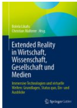
Extended Reality in Wirtschaft, Wissenschaft, Gesellschaft und Medien Ladenpreis: 56,53EUR