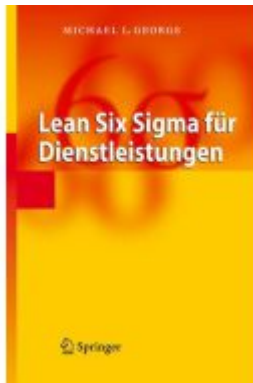
Lean Six Sigma für Dienstleistungen Ladenpreis: 46,30EUR