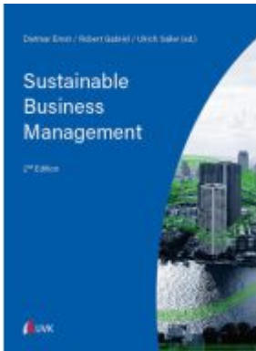
Sustainable Business Management Ladenpreis: 44,20EUR