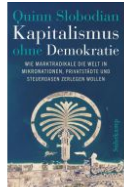
Kapitalismus ohne Demokratie Ladenpreis: 32,90EUR