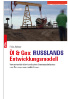
RUSSLAND: Ende einer Weltmacht Ladenpreis: 30,70EUR