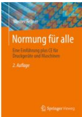
Normung für alle Ladenpreis: 46,26EUR