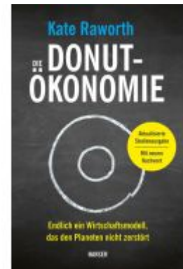
Die Donut-Ökonomie (Studienausgabe) Ladenpreis: 20,60EUR