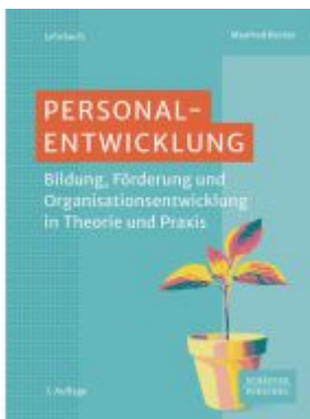
Personalentwicklung Ladenpreis: 51,40EUR