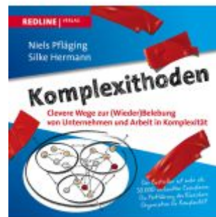
Komplexithoden Ladenpreis: 15,50EUR