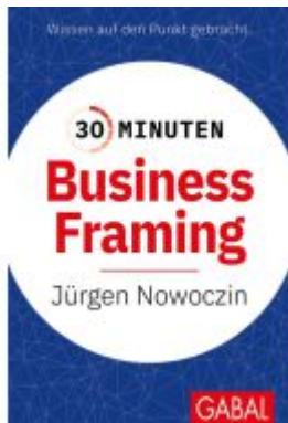
30 Minuten Business Framing Ladenpreis: 11,30EUR

Wir haben andere Produkte gefunden, die Ihnen gefallen könnten!