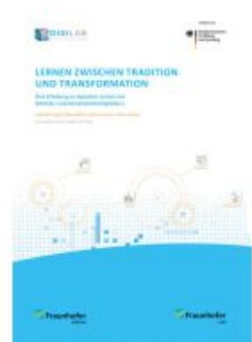
Lernen zwischen Tradition und Transformation Ladenpreis: 71,00EUR