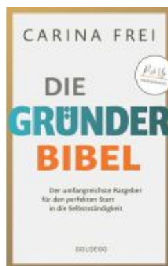
Gründerbibel Ladenpreis: 24,95EUR