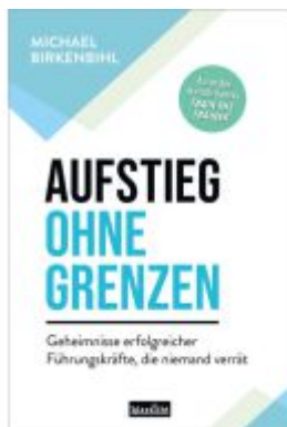
Aufstieg ohne Grenzen Ladenpreis: 19,60EUR