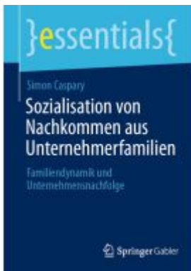
Sozialisierung von Nachkommen aus Unternehmerfamilien Ladenpreis: 15,41EUR