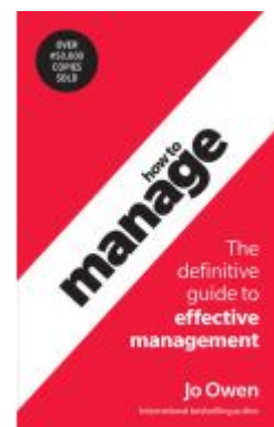
How to Manage Ladenpreis: 21,39EUR