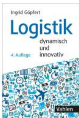
Logistik - dynamisch und innovativ Ladenpreis: 35,90EUR