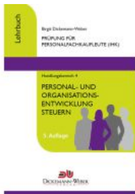
Personalfachkaufleute - Lehrbuch Handlungsbereich 4 - Personal- und Organisationsentwicklung steuern Ladenpreis: 30,95EUR