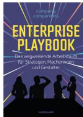
Enterprise Playbook Ladenpreis: 40,10EUR