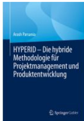
HYPERID – Die hybride Methodologie für Projektmanagement und Produktentwicklung Ladenpreis: 51,39EUR