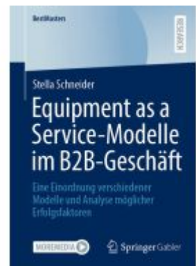
Equipment as a Service-Modelle im B2B- Geschäft Ladenpreis: 61,67EUR