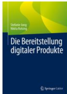
Die Bereitstellung digitaler Produkte Ladenpreis: 51,39EUR