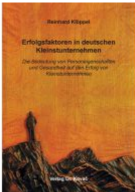
Erfolgsfaktoren in deutschen Kleinstunternehmen Ladenpreis: 88,30EUR