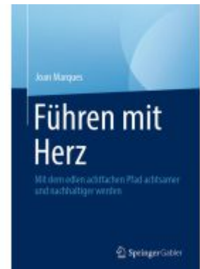
Führen mit Herz Ladenpreis: 39,06EUR