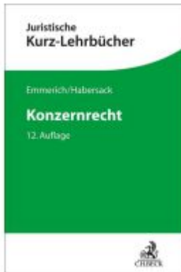
Konzernrecht Ladenpreis: 51,20EUR