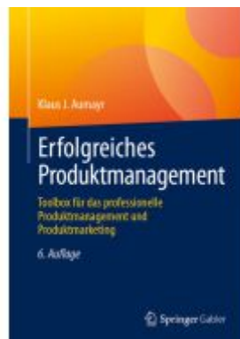
Erfolgreiches Produktmanagement Ladenpreis: 61,67EUR