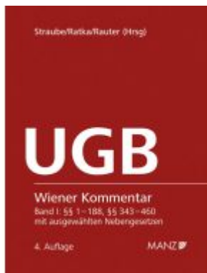
Wiener Kommentar zum UGB 4. Auflage Ladenpreis: 398,00EUR