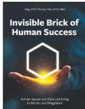
Invisible Brick of Human Success Ladenpreis: 21,90EUR