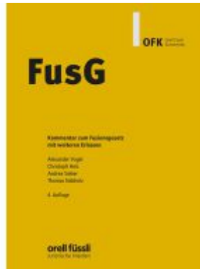
FusG Kommentar Ladenpreis: 203,60EUR