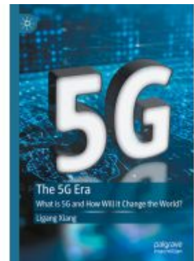
The 5G Era Ladenpreis: 153,99EUR