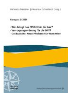
Was bringt das BRSG II für die bAV? Versorgungsordnung für die bKV? Geldwäsche: Neue Pflichten für Vermittler! Ladenpreis: 35,90EUR