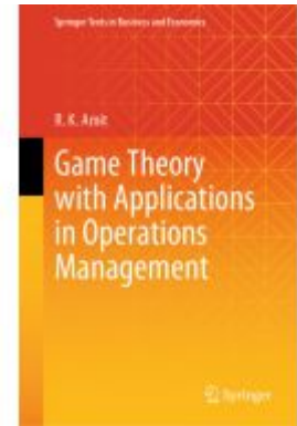
Game Theory with Applications in Operations Management Ladenpreis: 109,99EUR