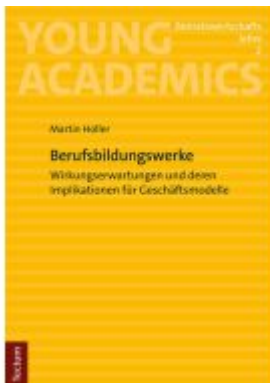
Berufsbildungswerke Ladenpreis: 24,70EUR

Wir haben andere Produkte gefunden, die Ihnen gefallen könnten!