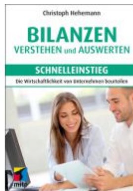
Bilanzen verstehen und auswerten - Schnelleinstieg Ladenpreis: 20,60EUR