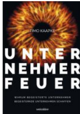
Unternehmerfeuer Ladenpreis: 30,80EUR