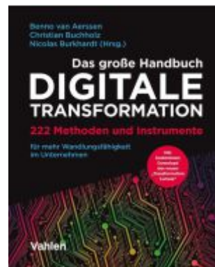
Das große Handbuch Digitale Transformation Ladenpreis: 81,30EUR