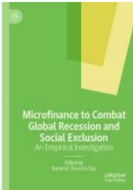
Microfinance to Combat Global Recession and Social Exclusion Ladenpreis: 175,99EUR