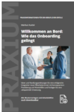
Willkommen an Bord: Wie das Onboarding gelingt Ladenpreis: 48,00EUR