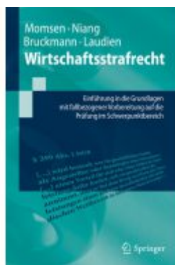
Wirtschaftsstrafrecht Ladenpreis: 30,83EUR