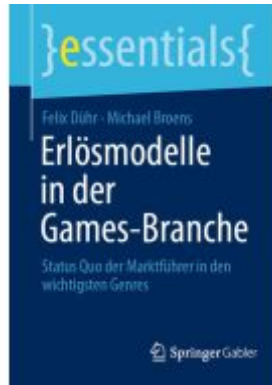
Erlösmodelle in der Games-Branche Ladenpreis: 15,41EUR