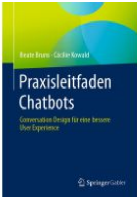
Praxisleitfaden Chatbots Ladenpreis: 25,69EUR