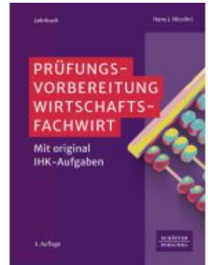
Prüfungsvorbereitung Wirtschaftsfachwirt Ladenpreis: 72,00EUR