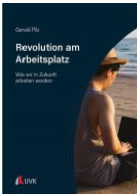
Revolution am Arbeitsplatz Ladenpreis: 30,90EUR

Wir haben andere Produkte gefunden, die Ihnen gefallen könnten!