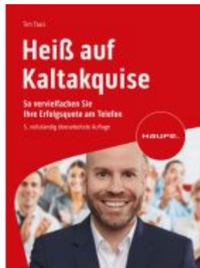
Heiß auf Kaltakquise Ladenpreis: 30,90EUR