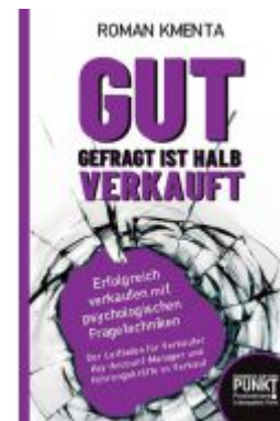
Gut gefragt ist halb verkauft Ladenpreis: 19,97EUR