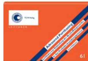
Advanced Purchasing Ladenpreis: 257,10EUR