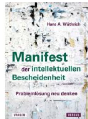
Manifest der intellektuellen Bescheidenheit Ladenpreis: 24,90EUR