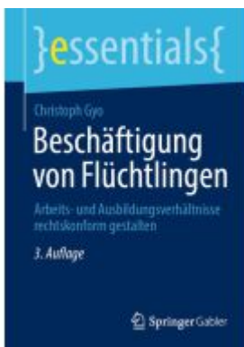
Beschäftigung von Flüchtlingen Ladenpreis: 15,41EUR