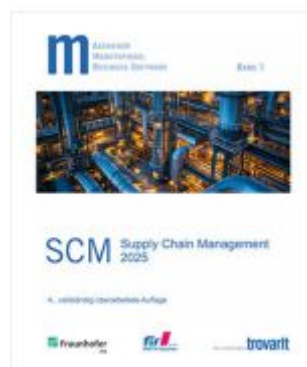
Marktspiegel Business Software Supply Chain Management 2025 Ladenpreis: 330,00EUR