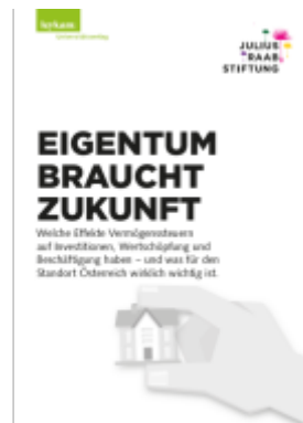
EIGENTUM BRAUCHT ZUKUNFT Ladenpreis: 35,00EUR