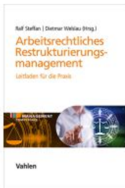
Arbeitsrechtliches Restrukturierungsmanagement Ladenpreis: 71,00EUR