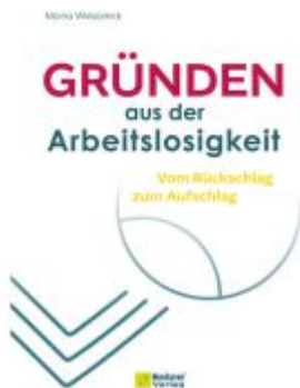
Gründen aus der Arbeitslosigkeit Ladenpreis: 25,70EUR

Wir haben andere Produkte gefunden, die Ihnen gefallen könnten!