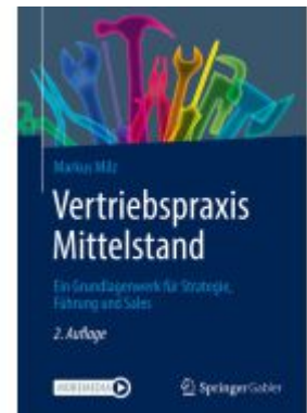
Vertriebspraxis Mittelstand Ladenpreis: 46,26EUR