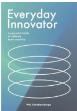
Everyday Innovator Ladenpreis: 22,99EUR