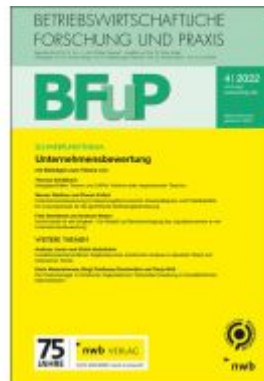
Unternehmensbewertung Ladenpreis: 36,60EUR