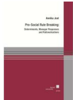
Pro-Social Rule Breaking Ladenpreis: 40,10EUR