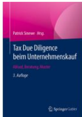
Tax Due Diligence beim Unternehmenskauf Ladenpreis: 61,68EUR