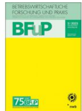
Risikomanagement Ladenpreis: 40,30EUR