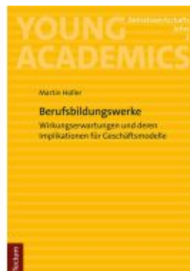
Berufsbildungswerke Ladenpreis: 24,70EUR