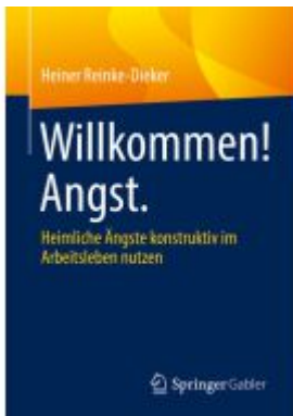
Willkommen! Angst. Ladenpreis: 46,25EUR

Wir haben andere Produkte gefunden, die Ihnen gefallen könnten!