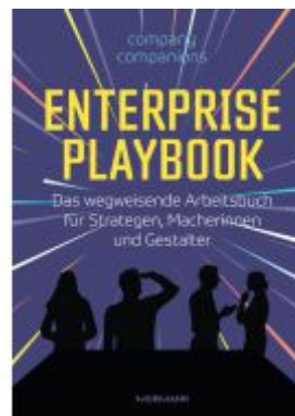
Enterprise Playbook Ladenpreis: 40,10EUR