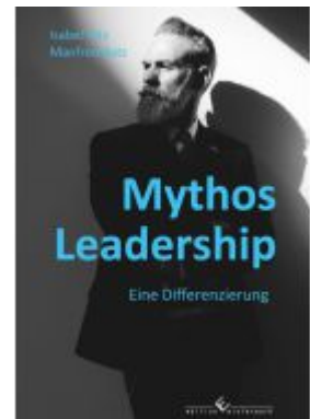
Mythos Leadership Ladenpreis: 25,60EUR