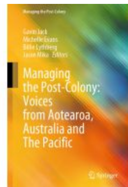
Managing the Post-Colony: Voices from Aotearoa, Australia and The Pacific Ladenpreis: 175,99EUR