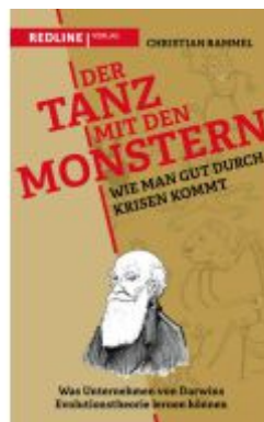
Der Tanz mit den Monstern – Wie man gut durch Krisen kommt Ladenpreis: 22,70EUR