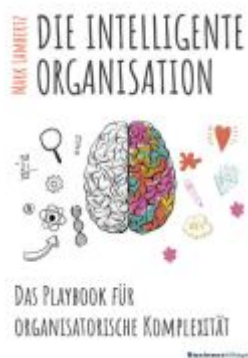
DIE INTELLIGENTE ORGANISATION Ladenpreis: 25,70EUR