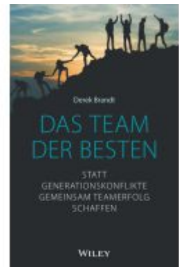
Das Team der Besten Ladenpreis: 25,70EUR