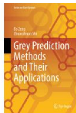
Grey Prediction Methods and Their Applications Ladenpreis: 120,99EUR