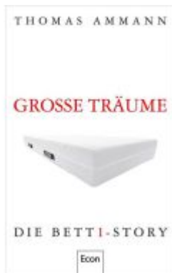
Große Träume Ladenpreis: 25,70EUR