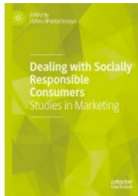
Dealing with Socially Responsible Consumers Ladenpreis: 71,49EUR