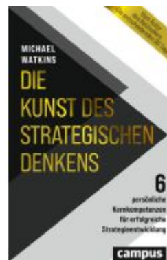
Die Kunst des strategischen Denkens Ladenpreis: 26,90EUR