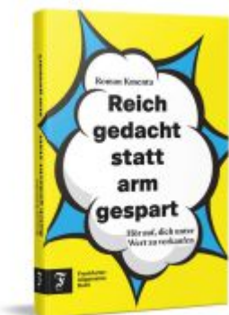
Reich gedacht statt arm gespart Ladenpreis: 20,60EUR

Wir haben andere Produkte gefunden, die Ihnen gefallen könnten!