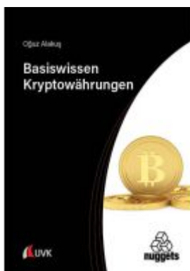
Basiswissen Kryptowährungen Ladenpreis: 18,50EUR