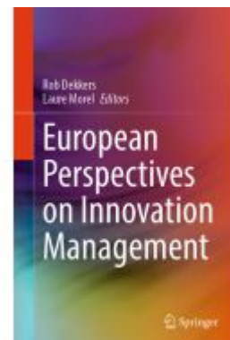
European Perspectives on Innovation Management Ladenpreis: 307,99EUR