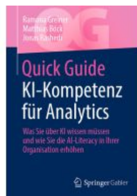
Quick Guide KI-Kompetenz für Analytics Ladenpreis: 30,83EUR