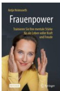
Frauenpower Ladenpreis: 23,63EUR