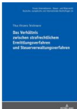
Das Verhältnis zwischen strafrechtlichem Ermittlungsverfahren und Steuerverwaltungsverfahren Ladenpreis: 56,50EUR