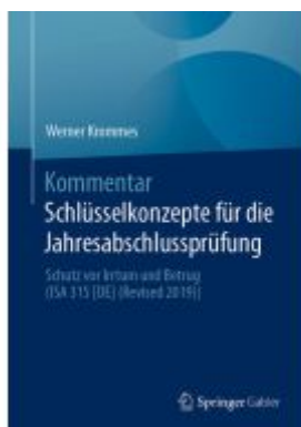
Kommentar Schlüsselkonzepte für die Jahresabschlussprüfung Ladenpreis: 102,79EUR