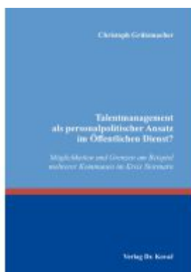
Talentmanagement als personalpolitischer Ansatz im Öffentlichen Dienst? Ladenpreis: 102,60EUR