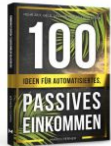
100 Ideen für automatisiertes, passives Einkommen Ladenpreis: 20,50EUR