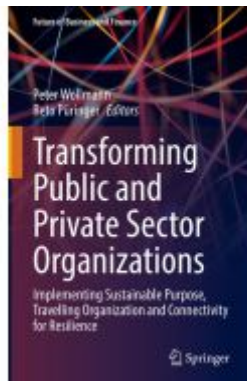
Transforming Public and Private Sector Organizations Ladenpreis: 54,99EUR