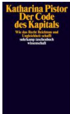
Der Code des Kapitals Ladenpreis: 24,70EUR