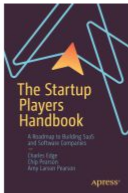
The Startup Players Handbook Ladenpreis: 49,49EUR