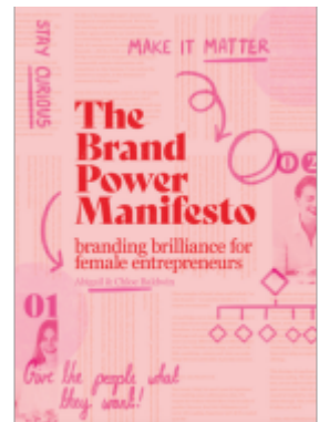
The Brand Power Manifesto Ladenpreis: 22,99EUR