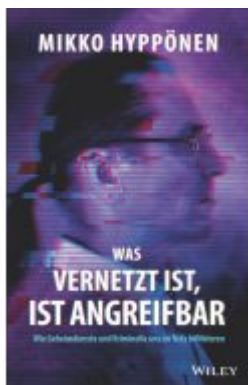
Was vernetzt ist, ist angreifbar Ladenpreis: 25,70EUR