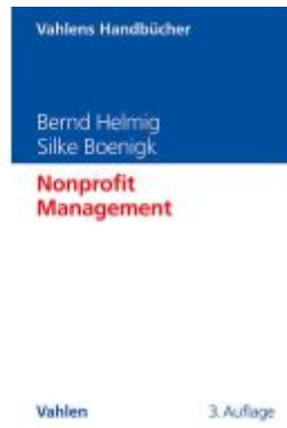
Nonprofit Management Ladenpreis: 38,00EUR