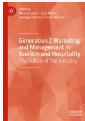
Generation Z Marketing and Management in Tourism and Hospitality Ladenpreis: 197,99EUR