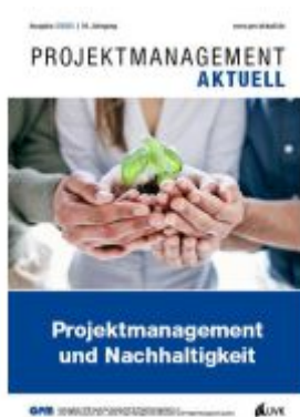
PROJEKTMANAGEMENT AKTUELL 3 (2023) Ladenpreis: 20,60EUR