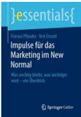
Impulse für das Marketing im New Normal Ladenpreis: 15,41EUR