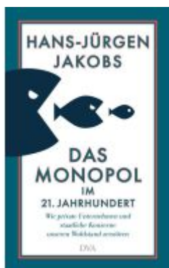
Das Monopol im 21. Jahrhundert Ladenpreis: 37,10EUR