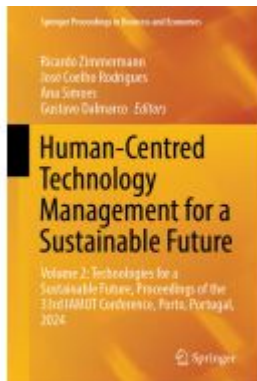
Human-Centred Technology Management for a Sustainable Future Ladenpreis: 241,99EUR