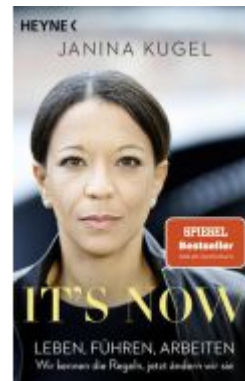
It's now Ladenpreis: 12,40EUR