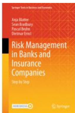
Risk Management in Banks and Insurance Companies Ladenpreis: 109,99EUR