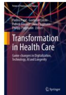
Transformation in Health Care Ladenpreis: 98,99EUR