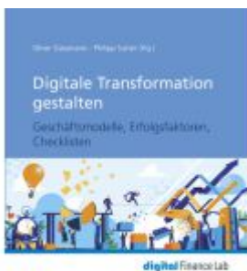
Digitale Transformation gestalten Ladenpreis: 54,20EUR