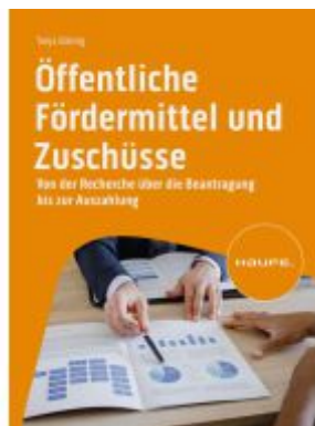
Öffentliche Fördermittel und Zuschüsse Ladenpreis: 56,60EUR