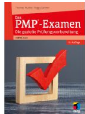
Das PMP®-Examen Ladenpreis: 51,40EUR