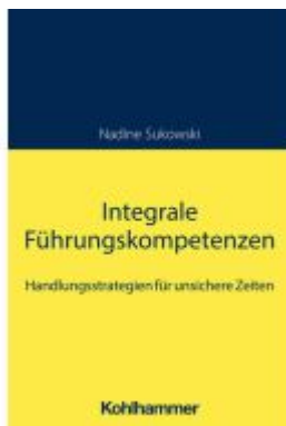
Integrale Führungskompetenzen Ladenpreis: 27,80EUR