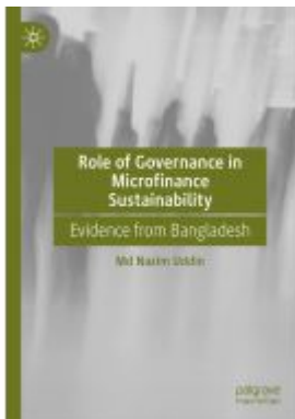
Role of Governance in Microfinance Sustainability Ladenpreis: 120,99EUR

Wir haben andere Produkte gefunden, die Ihnen gefallen könnten!