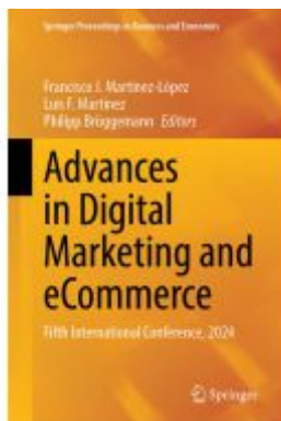
Advances in Digital Marketing and eCommerce