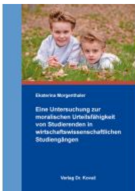
Eine Untersuchung zur moralischen Urteilsfähigkeit von Studierenden in wirtschaftswissenschaftlichen Studiengängen Ladenpreis: 87,20EUR