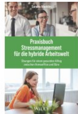
Praxisbuch Stressmanagement für die hybride Arbeitswelt Ladenpreis: 20,60EUR