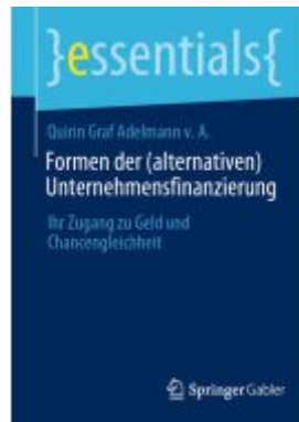
Formen der (alternativen) Unternehmensfinanzierung Ladenpreis: 15,41EUR