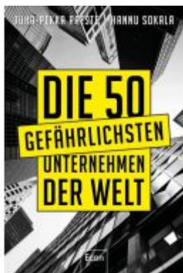
Die 50 gefährlichsten Unternehmen der Welt