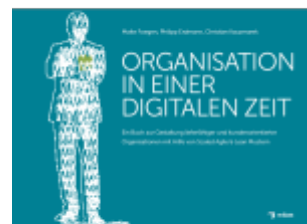
Organisation in einer Digitalen Zeit