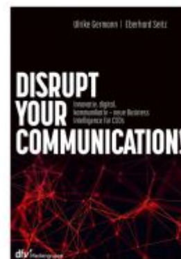
Disrupt your Communication! Ladenpreis: 49,40EUR