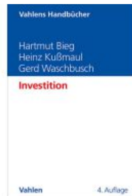
Investition Ladenpreis: 38,00EUR