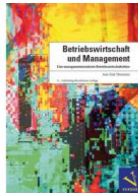
Betriebswirtschaft und Management Ladenpreis: 98,00EUR