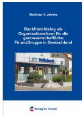
Bankfranchising als Organisationsform für die genossenschaftliche FinanzGruppe in Deutschland Ladenpreis: 154,00EUR