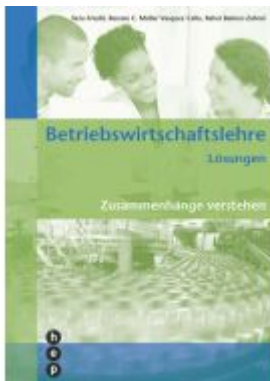
Betriebswirtschaftslehre Lösungen Ladenpreis: 44,30EUR