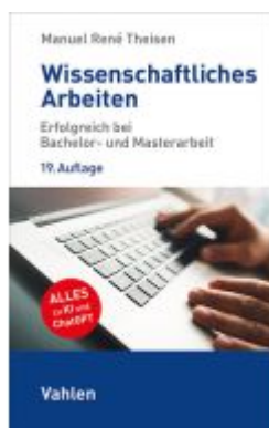
Wissenschaftliches Arbeiten Ladenpreis: 19,50EUR