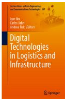
Digital Technologies in Logistics and Infrastructure Ladenpreis: 186,99EUR