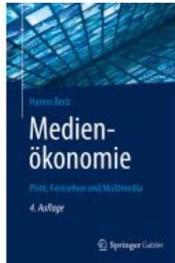
Medienökonomie Ladenpreis: 51,39EUR