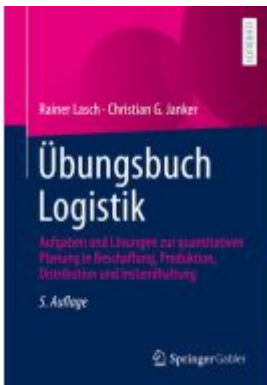
Übungsbuch Logistik Ladenpreis: 35,97EUR