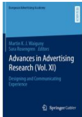
Advances in Advertising Research (Vol. XI) Ladenpreis: 164,99EUR