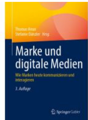
Marke und digitale Medien Ladenpreis: 56,53EUR