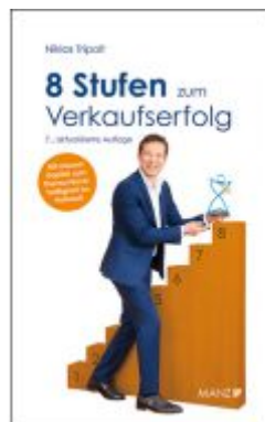
8 Stufen zum Verkaufserfolg Ladenpreis: 24,90EUR