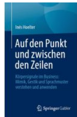
Auf den Punkt und zwischen den Zeilen Ladenpreis: 25,69EUR