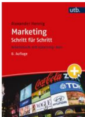
Marketing Schritt für Schritt Ladenpreis: 33,90EUR