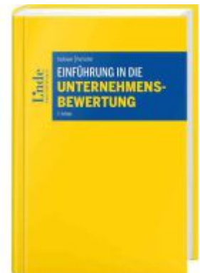
Einführung in die Unternehmensbewertung Ladenpreis: 85,00EUR