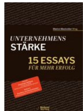
Unternehmensstärke Ladenpreis: 29,90EUR