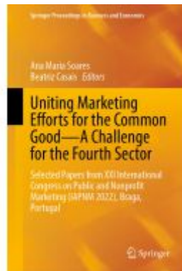
Uniting Marketing Efforts for the Common Good—A Challenge for the Fourth Sector Ladenpreis: 197,99EUR