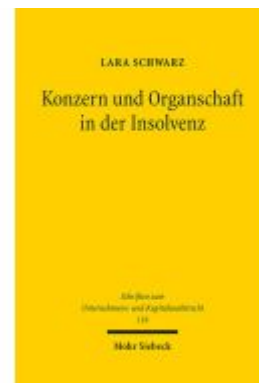
Konzern und Organschaft in der Insolvenz Ladenpreis: 107,00EUR