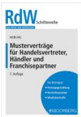
Musterverträge für Handelsvertreter, Händler und Franchisepartner Ladenpreis: 18,30EUR