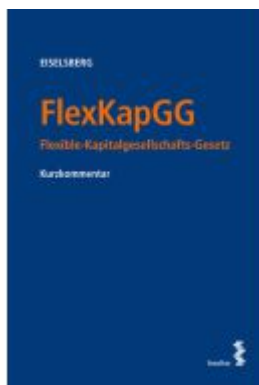
FlexKapGG Ladenpreis: 48,00EUR