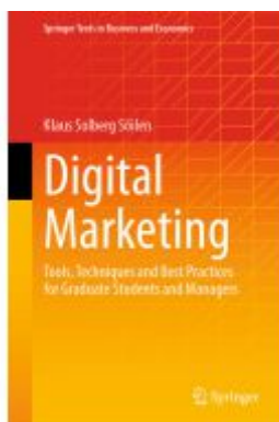
Digital Marketing Ladenpreis: 120,99EUR