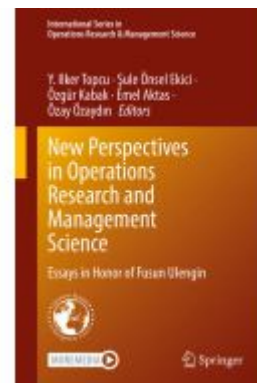
New Perspectives in Operations Research and Management Science Ladenpreis: 186,99EUR