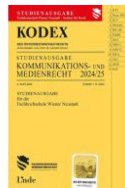
KODEX Studienausgabe Kommunikations- und Medienrecht 2024/25 Ladenpreis: 20,00EUR