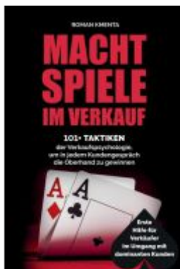
Machtspiele im Verkauf Ladenpreis: 19,97EUR