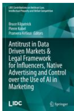
Antitrust in Data Driven Markets & Legal Framework for Influencers, Native Advertising and Control over the Use of AI in Marketing Ladenpreis: 252,99EUR