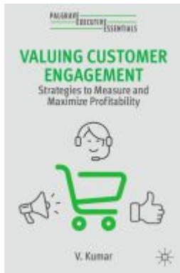
Valuing Customer Engagement Ladenpreis: 36,29EUR