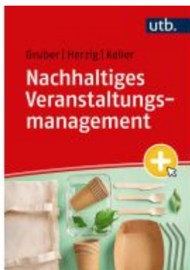
Nachhaltiges Veranstaltungsmanagement Ladenpreis: 28,70EUR

Wir haben andere Produkte gefunden, die Ihnen gefallen könnten!