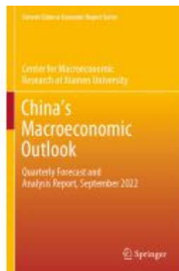
China's Macroeconomic Outlook Ladenpreis: 120,99EUR