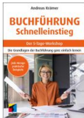
Buchführung Schnelleinstieg Ladenpreis: 17,50EUR