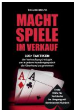
Machtspiele im Verkauf Ladenpreis: 29,90EUR

Wir haben andere Produkte gefunden, die Ihnen gefallen könnten!