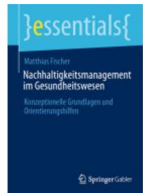
Nachhaltigkeitsmanagement im Gesundheitswesen Ladenpreis: 15,41EUR