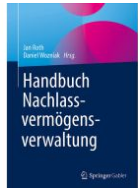
Handbuch Nachlassvermögensverwaltung Ladenpreis: 77,09EUR