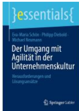
Der Umgang mit Agilität in der Unternehmenskultur Ladenpreis: 15,41EUR