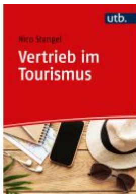
Vertrieb im Tourismus Ladenpreis: 25,60EUR