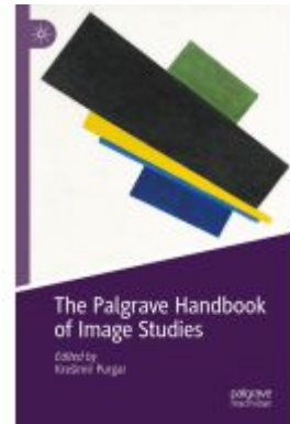
The Palgrave Handbook of Image Studies Ladenpreis: 241,99EUR