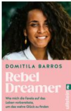
Rebel Dreamer Ladenpreis: 14,40EUR