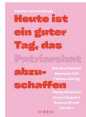
Heute ist ein guter Tag, das Patriarchat abzuschaffen. Ladenpreis: 23,70EUR