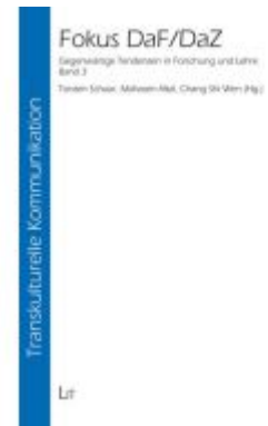
Fokus DaF/DaZ Ladenpreis: 64,90EUR