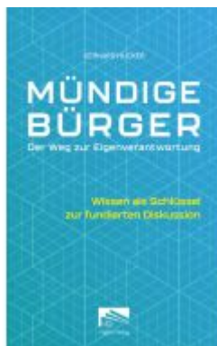
Mündige Bürger Ladenpreis: 25,70EUR