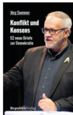
Konflikt und Konsens Ladenpreis: 15,30EUR