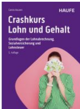
Crashkurs Lohn und Gehalt Ladenpreis: 36,00EUR

Wir haben andere Produkte gefunden, die Ihnen gefallen könnten!