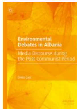
Environmental Debates in Albania Ladenpreis: 131,99EUR