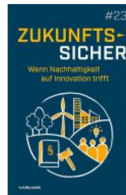
Zukunftssicher #23 Ladenpreis: 40,10EUR