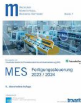
Marktspiegel Business Software – MES - Fertigungssteuerung 2023/2024 Ladenpreis: 330,00EUR