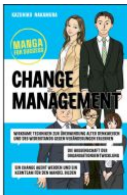
Manga for Success - Change Management Ladenpreis: 22,70EUR