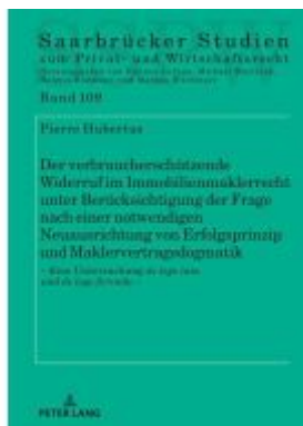
Der verbraucherschützende Widerruf im Immobilienmaklerrecht unter Berücksichtigung der Frage nach einer notwendigen Neuausrichtung von Erfolgsprinzip und Maklervertragsdogmatik Ladenpreis: 56,50EUR