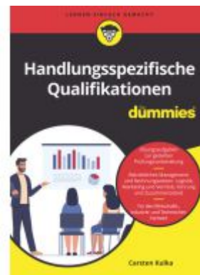
Handlungsspezifische Qualifikationen für Dummies Ladenpreis: 41,20EUR