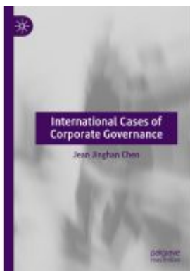
International Cases of Corporate Governance Ladenpreis: 54,99EUR