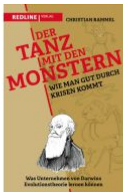
Der Tanz mit den Monstern – Wie man gut durch Krisen kommt Ladenpreis: 22,70EUR

Wir haben andere Produkte gefunden, die Ihnen gefallen könnten!