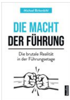
Die Macht der Führung Ladenpreis: 25,70EUR