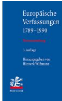
Europäische Verfassungen 1789-1990 Ladenpreis: 18,50EUR