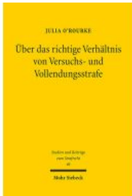
Über das richtige Verhältnis von Versuchs- und Vollendungsstrafe Ladenpreis: 76,10EUR