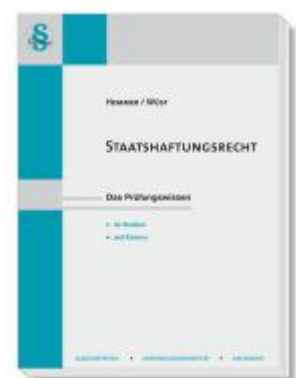
Staatshaftungsrecht Ladenpreis: 23,60EUR