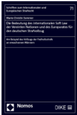
Die Bedeutung des internationalen Soft Law der Vereinten Nationen und des Europarates für den deutschen Strafvollzug Ladenpreis: 149,00EUR