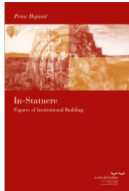
In-Statuere Ladenpreis: 60,70EUR