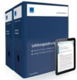
Mustersammlung Leistungsstörungen Ladenpreis: 261,80EUR