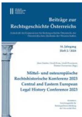
Beiträge zur Rechtsgeschichte Österreichs, 14. Jahrgang, Heft 2/2024 Ladenpreis: 69,00EUR