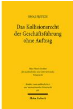
Das Kollisionsrecht der Geschäftsführung ohne Auftrag Ladenpreis: 86,40EUR