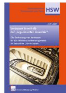
Vertrauen innerhalb der "organisierten Anarchie" Ladenpreis: 61,60EUR