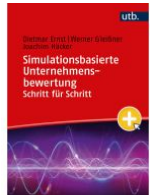
Simulationsbasierte Unternehmensbewertung Schritt für Schritt Ladenpreis: 27,70EUR