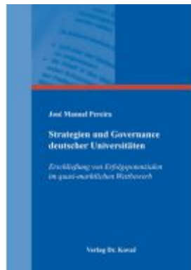
Strategien und Governance deutscher Universitäten Ladenpreis: 99,60EUR