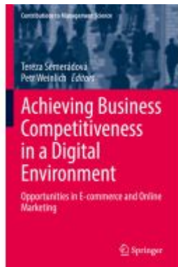
Achieving Business Competitiveness in a Digital Environment Ladenpreis: 164,99EUR

Wir haben andere Produkte gefunden, die Ihnen gefallen könnten!