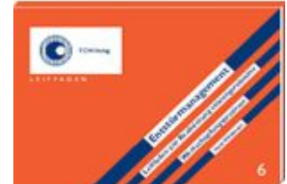
Entstörmanagement Ladenpreis: 257,10EUR