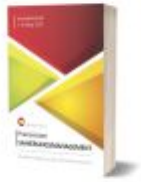
Praxiswissen Sanierungsmanagement Ladenpreis: 16,43EUR