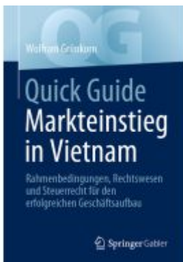
Quick Guide Markteinstieg in Vietnam Ladenpreis: 25,69EUR