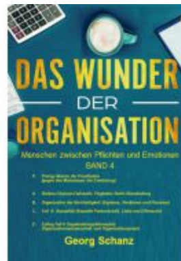
Das Wunder der Organisation - Band 4 Ladenpreis: 23,60EUR