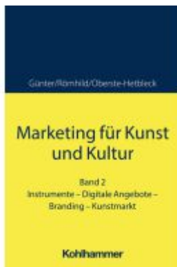
Marketing für Kunst und Kultur Ladenpreis: 40,10EUR