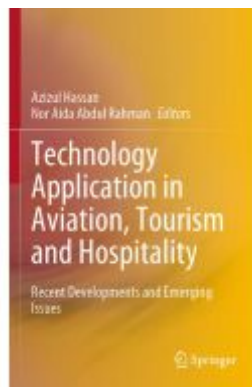
Technology Application in Aviation, Tourism and Hospitality Ladenpreis: 186,99EUR