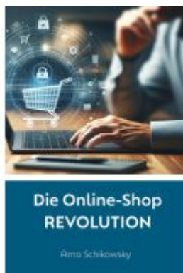
Die Online-Shop REVOLUTION Ladenpreis: 17,95EUR