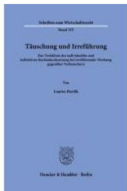
Täuschung und Irreführung Ladenpreis: 123,30EUR