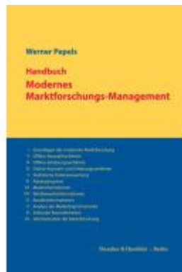
Handbuch Modernes Marktforschungs- Management. Ladenpreis: 102,70EUR