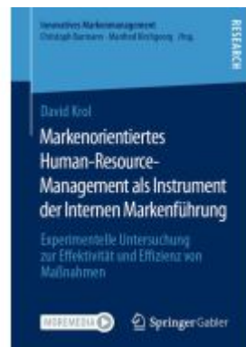
Markenorientiertes Human-Resource- Management als Instrument der Internen Markenführung Ladenpreis: 77,09EUR