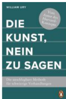
Die Kunst, Nein zu sagen Ladenpreis: 18,50EUR

Wir haben andere Produkte gefunden, die Ihnen gefallen könnten!