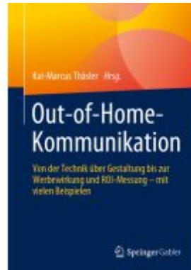
Out-of-Home-Kommunikation Ladenpreis: 56,53EUR