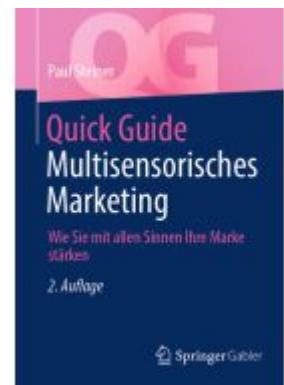
Quick Guide Multisensorisches Marketing Ladenpreis: 28,77EUR