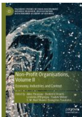
Non-Profit Organisations, Volume II Ladenpreis: 175,99EUR