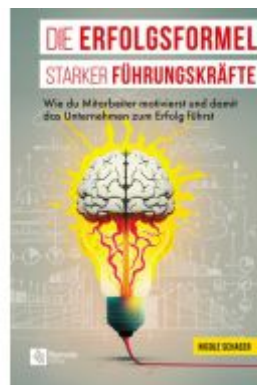
Die Erfolgsformel starker Führungskräfte Ladenpreis: 21,99EUR