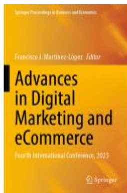
Advances in Digital Marketing and eCommerce Ladenpreis: 219,99EUR