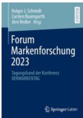
Forum Markenforschung 2023 Ladenpreis: 102,79EUR