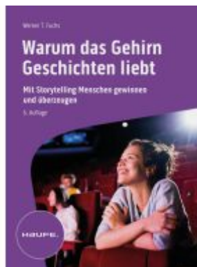
Warum das Gehirn Geschichten liebt Ladenpreis: 51,40EUR