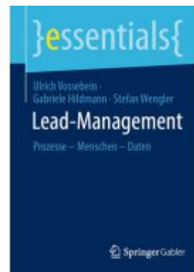
Lead-Management Ladenpreis: 15,41EUR