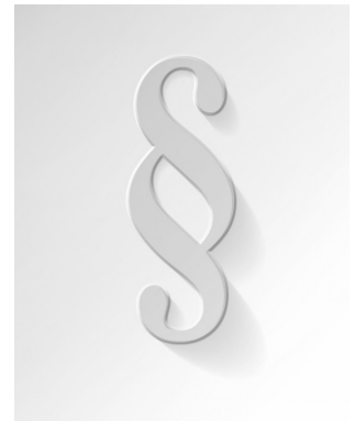
Management von Risiko, Nachhaltigkeit und KI in der Beschaffung Ladenpreis: 82,23EUR