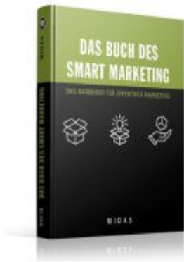
Das Buch des SMART MARKETING Ladenpreis: 15,40EUR