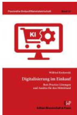
Digitalisierung im Einkauf. Ladenpreis: 51,30EUR

Wir haben andere Produkte gefunden, die Ihnen gefallen könnten!