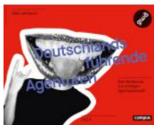
Deutschlands führende Agenturen Ladenpreis: 49,40EUR