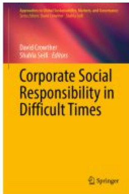
Corporate Social Responsibility in Difficult Times Ladenpreis: 175,99EUR