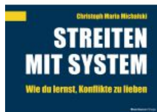
Streiten mit System Ladenpreis: 27,80EUR