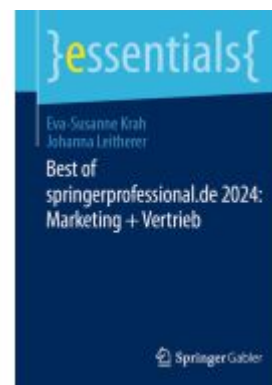
Best of springerprofessional.de 2024: Marketing + Vertrieb Ladenpreis: 15,41EUR