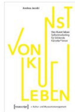
Von Kunst leben Ladenpreis: 27,00EUR