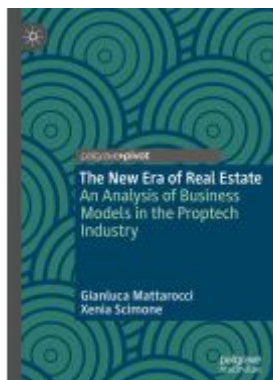
The New Era of Real Estate Ladenpreis: 49,49EUR