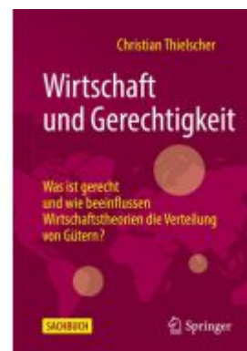
Wirtschaft und Gerechtigkeit Ladenpreis: 23,64EUR