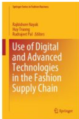
Use of Digital and Advanced Technologies in the Fashion Supply Chain Ladenpreis: 197,99EUR