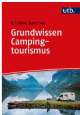
Grundwissen Campingtourismus Ladenpreis: 32,90EUR