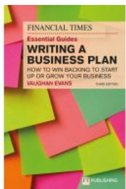
The Financial Times Essential Guide to Writing a Business Plan: How to win backing to start up or grow your business Ladenpreis: 26,74EUR