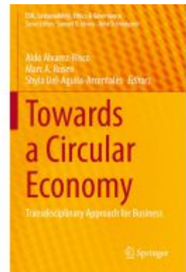
Towards a Circular Economy Ladenpreis: 175,99EUR