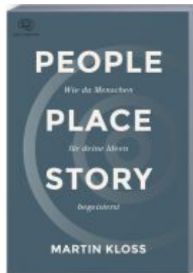
People Place Story Ladenpreis: 20,60EUR