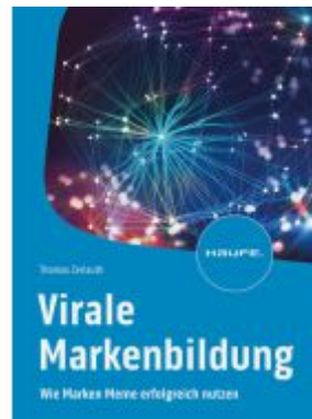
Virale Markenbildung Ladenpreis: 46,30EUR