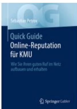
Quick Guide Online-Reputation für KMU Ladenpreis: 30,83EUR