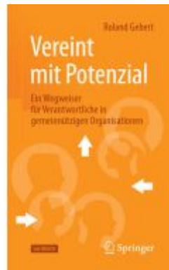
Vereint mit Potenzial Ladenpreis: 25,69EUR