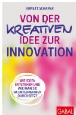
Von der kreativen Idee zur Innovation Ladenpreis: 25,80EUR