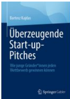
Überzeugende Start-up-Pitches Ladenpreis: 33,91EUR

Wir haben andere Produkte gefunden, die Ihnen gefallen könnten!