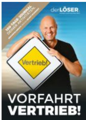
Vorfahrt Vertrieb! Ladenpreis: 79,00EUR