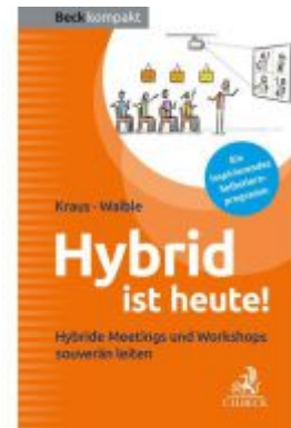
Hybrid ist heute! Ladenpreis: 10,20EUR