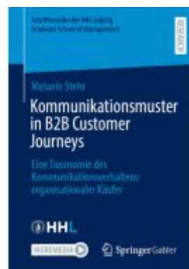
Kommunikationsmuster in B2B Customer Journeys Ladenpreis: 82,23EUR