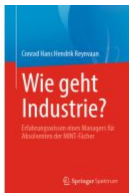
Wie geht Industrie? Ladenpreis: 41,11EUR