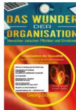
Das Wunder der Organisation - Band 5 Ladenpreis: 32,90EUR