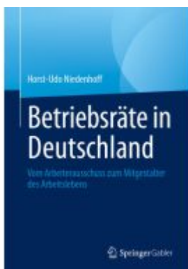
Betriebsräte in Deutschland Ladenpreis: 66,81EUR