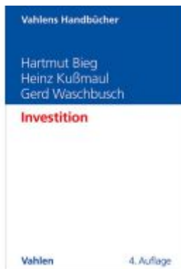
Investition Ladenpreis: 38,00EUR