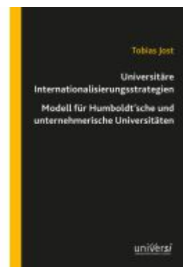
Universitäre Internationalisierungsstrategien – Modell für Humboldt'sche und unternehmerische Universitäten Ladenpreis: 19,00EUR