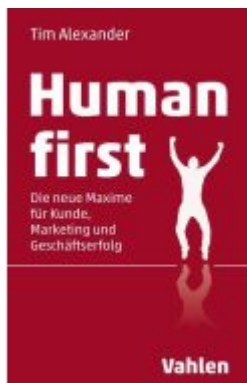
Human First Ladenpreis: 29,80EUR

Wir haben andere Produkte gefunden, die Ihnen gefallen könnten!