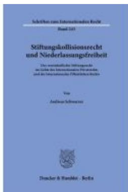
Stiftungskollisionsrecht und Niederlassungsfreiheit Ladenpreis: 92,50EUR