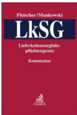
LkSG Ladenpreis: 142,90EUR