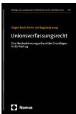
Unionsverfassungsrecht Ladenpreis: 286,90EUR