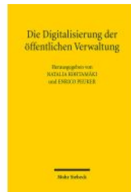
Die Digitalisierung der öffentlichen Verwaltung Ladenpreis: 91,50EUR