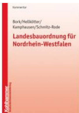
Landesbauordnung für Nordrhein-Westfalen Ladenpreis: 87,40EUR