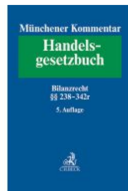
Münchener Kommentar zum Handelsgesetzbuch Bd. 4: Drittes Buch, Handelsbücher §§ 238-342r HGB Ladenpreis: 389,70EUR