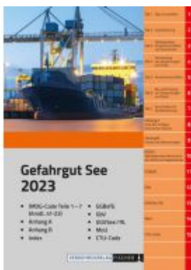
IMDG Code 2023 Gefahrgut See Ladenpreis: 148,50EUR