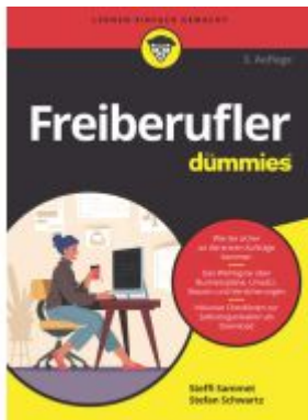
Freiberufler für Dummies Ladenpreis: 22,70EUR

Wir haben andere Produkte gefunden, die Ihnen gefallen könnten!