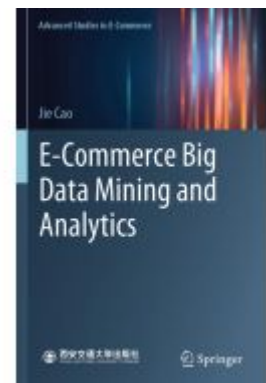
E-Commerce Big Data Mining and Analytics Ladenpreis: 54,99EUR