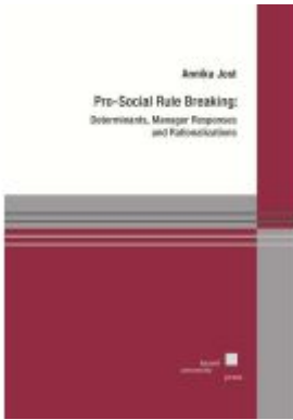
Pro-Social Rule Breaking Ladenpreis: 40,10EUR