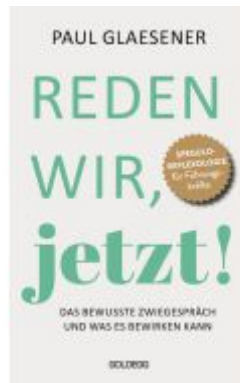
Reden wir, jetzt Ladenpreis: 22,00EUR