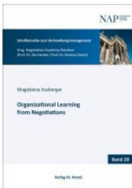
Organizational Learning from Negotiations Ladenpreis: 90,30EUR