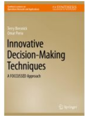
Innovative Decision-Making Techniques Ladenpreis: 54,99EUR