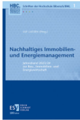
Nachhaltiges Immobilien- und Energiemanagement Ladenpreis: 61,70EUR