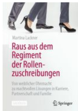
Raus aus dem Regiment der Rollenzuschreibungen Ladenpreis: 25,69EUR