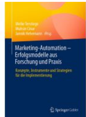
Marketing-Automation – Erfolgsmodelle aus Forschung und Praxis Ladenpreis: 56,53EUR