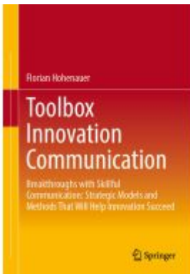
Toolbox Innovation Communication Ladenpreis: 82,49EUR