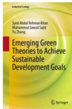
Emerging Green Theories to Achieve Sustainable Development Goals Ladenpreis: 153,99EUR