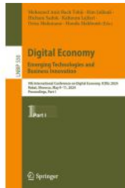
Digital Economy. Emerging Technologies and Business Innovation Ladenpreis: 142,99EUR