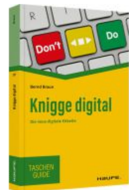
Knigge digital Ladenpreis: 10,30EUR