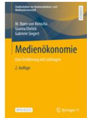
Medienökonomie Ladenpreis: 43,99EUR