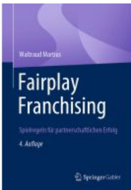
Fairplay Franchising Ladenpreis: 51,39EUR