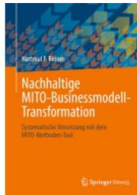
Nachhaltige MITO-Businessmodell- Transformation Ladenpreis: 71,95EUR