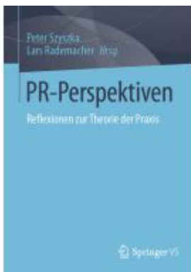
PR-Perspektiven Ladenpreis: 71,95EUR