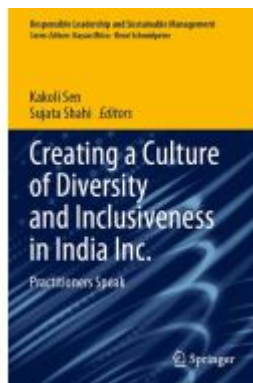
Creating a Culture of Diversity and Inclusiveness in India Inc. Ladenpreis: 164,99EUR