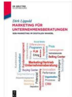
Marketing für Unternehmensberatungen Ladenpreis: 24,95EUR