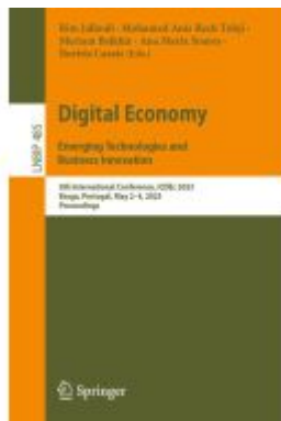
Digital Economy. Emerging Technologies and Business Innovation Ladenpreis: 81,39EUR