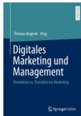
Digitales Marketing und Management Ladenpreis: 92,51EUR