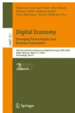
Digital Economy. Emerging Technologies and Business Innovation Ladenpreis: 142,99EUR