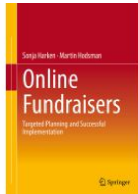
Online Fundraisers Ladenpreis: 71,49EUR