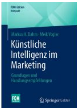
Künstliche Intelligenz im Marketing Ladenpreis: 20,55EUR

Wir haben andere Produkte gefunden, die Ihnen gefallen könnten!