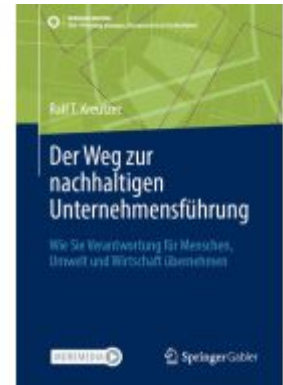
Der Weg zur nachhaltigen Unternehmensführung Ladenpreis: 56,53EUR