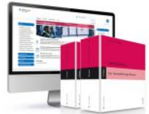
Der Instandhaltungs-Berater Ladenpreis: 459,80EUR