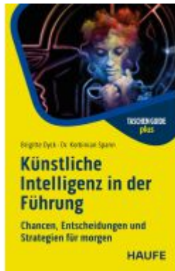
Künstliche Intelligenz in der Führung Ladenpreis: 15,50EUR