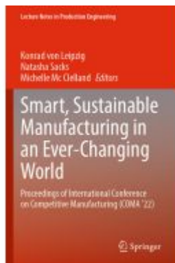
Smart, Sustainable Manufacturing in an Ever-Changing World Ladenpreis: 241,99EUR