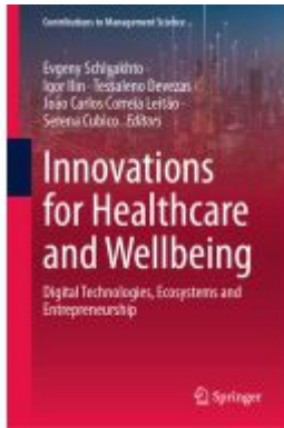
Innovations for Healthcare and Wellbeing Ladenpreis: 175,99EUR