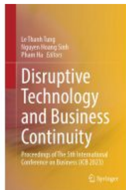
Disruptive Technology and Business Continuity Ladenpreis: 186,99EUR