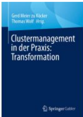
Clustermanagement in der Praxis: Transformation Ladenpreis: 46,25EUR

Wir haben andere Produkte gefunden, die Ihnen gefallen könnten!