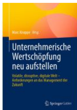
Unternehmerische Wertschöpfung neu aufstellen Ladenpreis: 61,67EUR