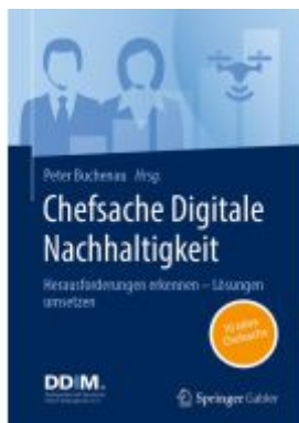
Chefsache Digitale Nachhaltigkeit Ladenpreis: 41,11EUR