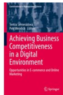
Achieving Business Competitiveness in a Digital Environment Ladenpreis: 164,99EUR