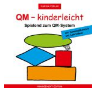
QM - kinderleicht / Spielend zum QM-System Ladenpreis: 100,80EUR