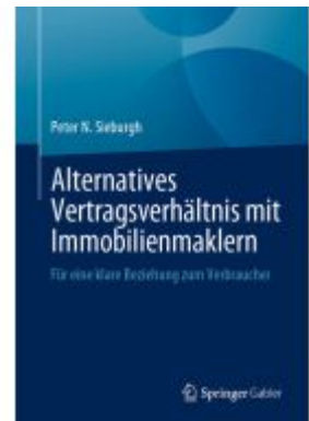
Alternatives Vertragsverhältnis mit Immobilienmaklern Ladenpreis: 66,81EUR