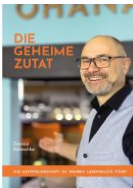
Die geheime Zutat Ladenpreis: 20,60EUR