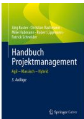
Handbuch Projektmanagement Ladenpreis: 61,67EUR