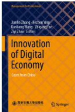
Innovation of Digital Economy Ladenpreis: 109,99EUR