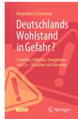
Deutschlands Wohlstand in Gefahr? Ladenpreis: 33,92EUR