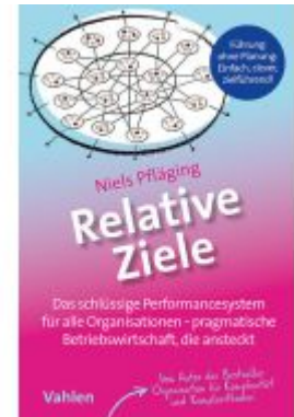
Relative Ziele Ladenpreis: 17,40EUR