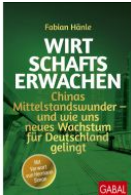
Wirtschaftserwachen Ladenpreis: 35,90EUR