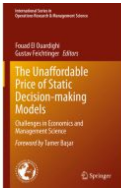
The Unaffordable Price of Static Decision- making Models Ladenpreis: 197,99EUR