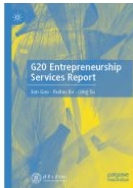
G20 Entrepreneurship Services Report Ladenpreis: 120,99EUR