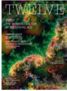
TWELVE 2023 Ladenpreis: 18,50EUR