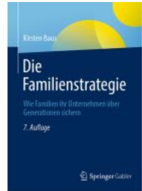
Die Familienstrategie Ladenpreis: 46,25EUR