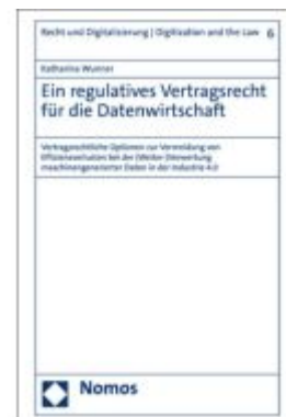
Ein regulatives Vertragsrecht für die Datenwirtschaft Ladenpreis: 137,80EUR