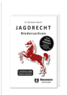
JAGDRECHT Niedersachsen Ladenpreis: 51,40EUR