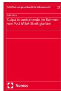
Culpa in contrahendo im Rahmen von Post M&A-Streitigkeiten Ladenpreis: 86,40EUR