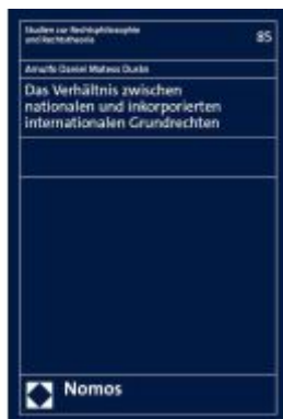
Das Verhältnis zwischen nationalen und inkorporierten internationalen Grundrechten Ladenpreis: 96,70EUR