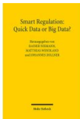
Smart Regulation: Quick Data or Big Data? Ladenpreis: 60,70EUR