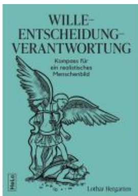
Wille-Entscheidung-Verantwortung Ladenpreis: 19,99EUR