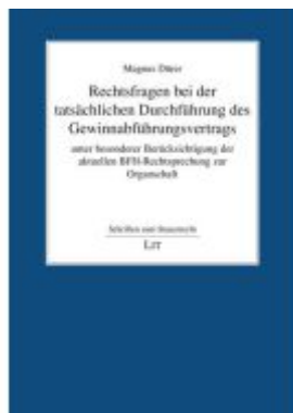
Rechtsfragen bei der tatsächlichen Durchführung des Gewinnabführungsvertrags unter besonderer Berücksichtigung der aktuellen BFH-Rechtsprechung zur Organschaft Ladenpreis: 19,90EUR