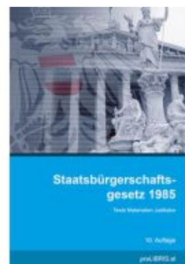
Staatsbürgerschaftsgesetz 1985 Ladenpreis: 30,00EUR