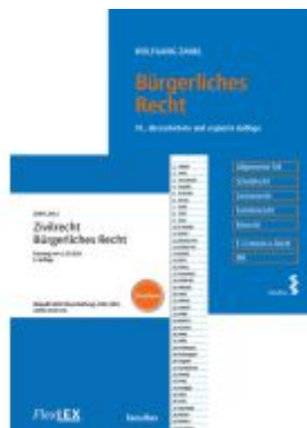
Kombipaket Bürgerliches Recht Ladenpreis: 68,00EUR