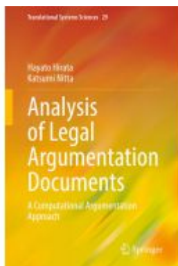
Analysis of Legal Argumentation Documents Ladenpreis: 142,99EUR