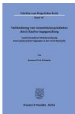
Verhinderung von Grundstücksspekulation durch Kaufvertragsgestaltung. Ladenpreis: 71,90EUR