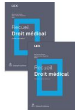
Recueil Droit médical Ladenpreis: 158,80EUR