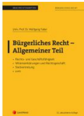
Bürgerliches Recht - Allgemeiner Teil (Skriptum) Ladenpreis: 26,25EUR