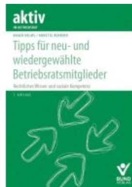
Tipps für neu- und wiedergewählte Betriebsratsmitglieder Ladenpreis: 25,60EUR