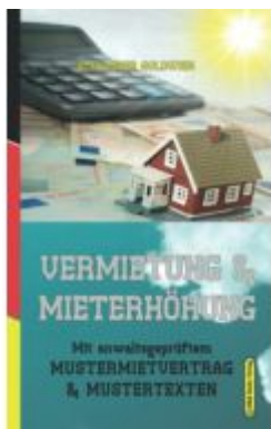
Vermietung & Mieterhöhung Ladenpreis: 29,90EUR