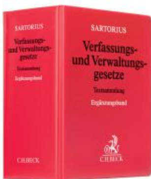
Verfassungs- und Verwaltungsgesetze Ergänzungsband Ladenpreis: 50,40EUR

Wir haben andere Produkte gefunden, die Ihnen gefallen könnten!