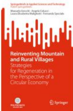
Reinventing Mountain and Rural Villages Ladenpreis: 54,99EUR