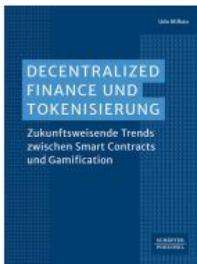
Decentralized Finance und Tokenisierung Ladenpreis: 72,00EUR

Wir haben andere Produkte gefunden, die Ihnen gefallen könnten!