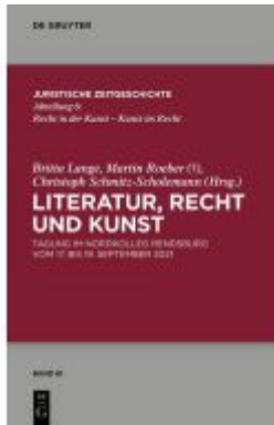
Literatur, Recht und Kunst Ladenpreis: 99,95EUR