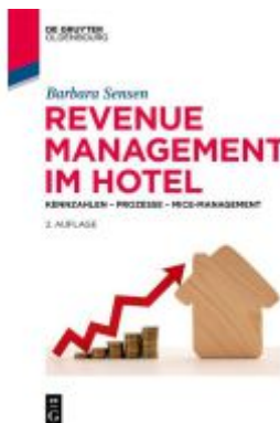
Revenue Management im Hotel Ladenpreis: 24,95EUR