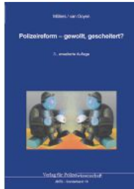
Polizeireform – gewollt, gescheitert? Ladenpreis: 35,90EUR