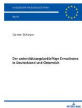
Der unterstützungsbedürftige Erwachsene in Deutschland und Österreich Ladenpreis: 56,50EUR