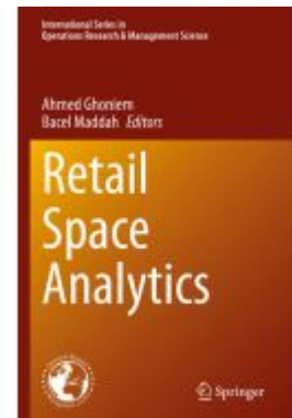
Retail Space Analytics Ladenpreis: 186,99EUR