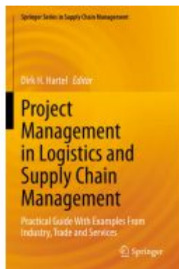
Project Management in Logistics and Supply Chain Management Ladenpreis: 71,49EUR