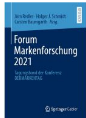
Forum Markenforschung 2021 Ladenpreis: 92,51EUR