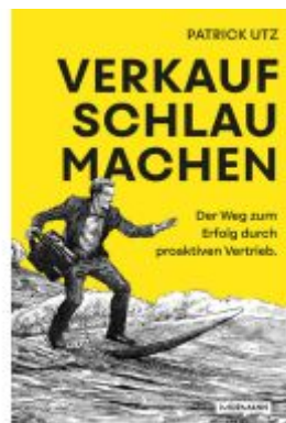
Verkauf. Schlau. Machen. Ladenpreis: 29,80EUR