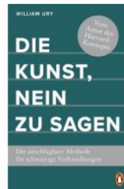
Die Kunst, Nein zu sagen Ladenpreis: 18,50EUR