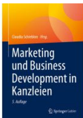
Marketing und Business Development in Kanzleien Ladenpreis: 77,09EUR