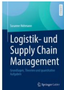
Logistik- und Supply Chain Management Ladenpreis: 39,05EUR