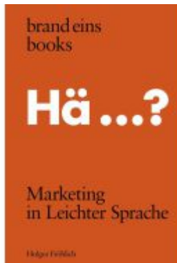
Marketing in Leichter Sprache Ladenpreis: 20,60EUR

Wir haben andere Produkte gefunden, die Ihnen gefallen könnten!