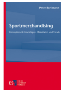
Sportmerchandising Ladenpreis: 51,40EUR