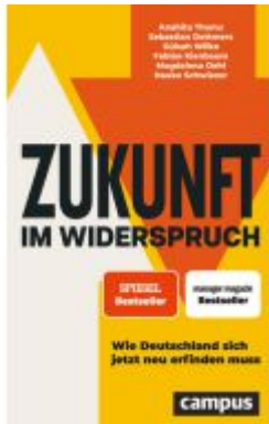
Zukunft im Widerspruch Ladenpreis: 32,90EUR