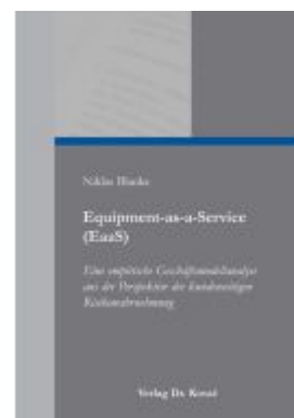
Equipment-as-a-Service (EaaS) – Eine empirische Geschäftsmodellanalyse aus der Perspektive der kundenseitigen Risikowahrnehmung Ladenpreis: 102,60EUR