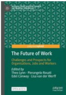
The Future of Work Ladenpreis: 54,99EUR