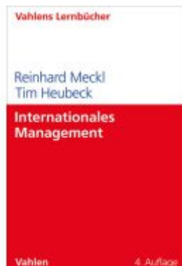
Internationales Management Ladenpreis: 35,90EUR