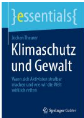
Klimaschutz und Gewalt Ladenpreis: 15,41EUR

Wir haben andere Produkte gefunden, die Ihnen gefallen könnten!