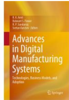
Advances in Digital Manufacturing Systems Ladenpreis: 164,99EUR