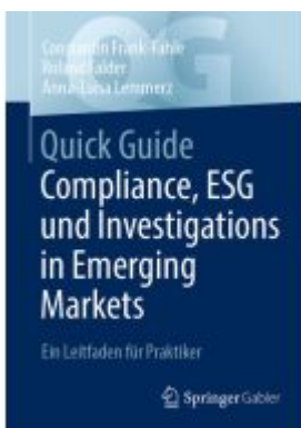
Quick Guide Compliance, ESG und Investigations in Emerging Markets Ladenpreis: 30,83EUR