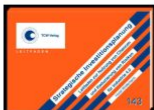
Strategische Investitionsplanung Ladenpreis: 257,10EUR